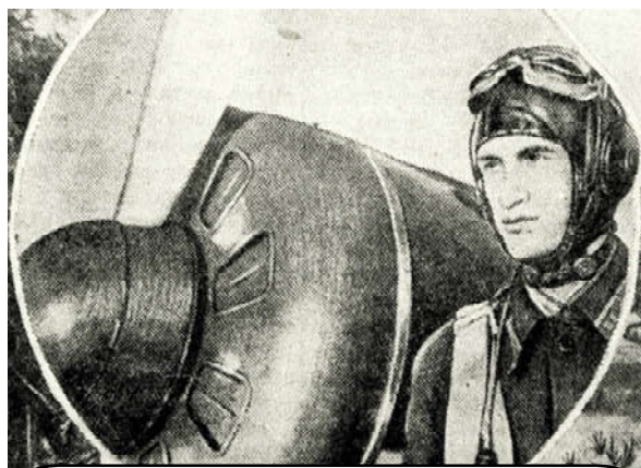
Фото из газеты «На страже Родины» 07.07.1941